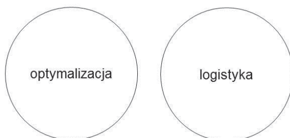
Rysunek 2. Hipoteza o rozłączności obszarów działań optymalizacyjnych i logistycznych

Punktem wyjścia do zbadania relacji między optymalizacją a logistyką jest próba odpowiedzi na pytanie: czy może istnieć logistyka bez optymalizacji? W tym celu należy więc postawić i zweryfikować hipotezę, że te dwa obszary działań stanowią zbiory rozłączne (rysunek 2).