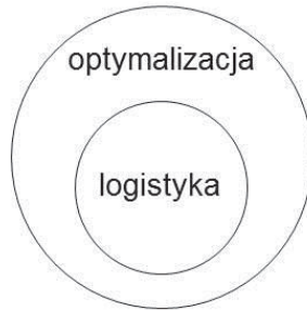
Rysunek 3. Hipoteza o zawieraniu się obszaru działań logistycznych w obszarze działań optymalizacyjnych